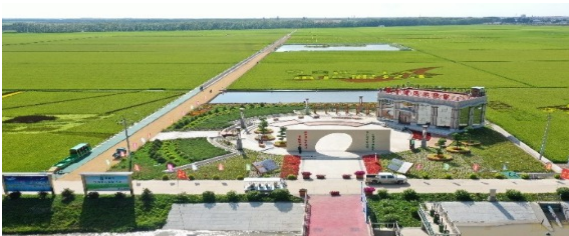
北大荒集团建三江分公司青龙山灌区 深化农业水价综合改革推进现代化灌区建设试点 工程布置图

√制定《青龙山灌区一期工程运行管理办法（试行）》，配套工程建设、运行管护、事故报告和应急响应等管护机制29项。强化标准化与规范化建设，灌区水费收缴率达100%。